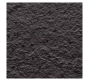
Riga Pattern+ Rock