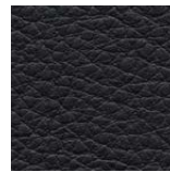
Riga Pattern+ Leather

Riga Pattern+ offre une sélection de textures standard (cuir, roche, ardoise) pour une plus grande souplesse de conception. Les surfaces directement pressées permettent une intégration harmonieuse de différentes textures et couleurs. Contactez-nous pour découvrir les possibilités de textures personnalisables afin de répondre aux besoins particuliers de votre projet.