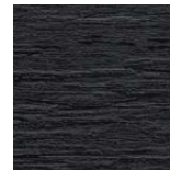
Riga Pattern+ Slatewood