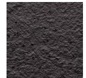
Riga Pattern+ Rock